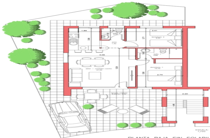
PLANTA BAJA SIN SOLARIUM VIVIENDA 054 SUP. PARCELA= 151,90 M2.

SUP. UTIL : 59,00 M2. SUP. CONSTRUIDA: 70,00 M2. SUP. DE PARCELA NETA: entre 117,00 y 201,00 M2.